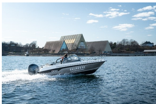
Skipperi が運営するレンタルボート